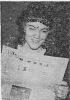
СВЕЖИИ НОМЕР!