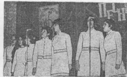
На сцене — слушатели вокального отделения ФОП. Лауреаты конкурса «Песня-74» — женский вокальный ансамбль.