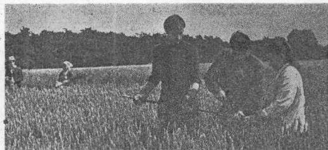
В учебно-опытном хозяйстве института студенты закрепляют полученные на лекциях и практических занятиях знания. На СНИМКЕ: поле учхоза — опытная и учебная лаборатория для студентов института.