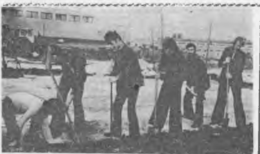
У студентов II курса факультета механизации субботник. Они благоустривают территорию цирка.

В. ГОЛОВИН, заведующий музеем института.