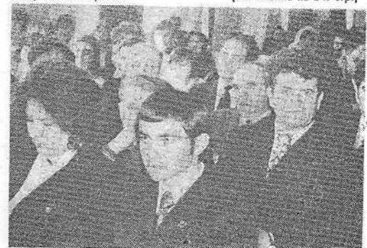
Внимательно слушают участники митинга слова горячего одобрения работы XXV съезда КПСС.

В день открытия XXV съезда на курсовых, факультетских,