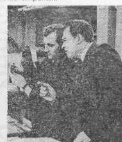
НА ОБЪЕКТАХ: здесь, в издательстве, рождается очередной номер газеты.

Конечно, потом пришлось проверить мою заметку, пра-вильно ли я написала. Но в общем заметка прошла почти без из-менений.