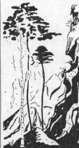
Пейзаж родного края. Рис. Е. ЧЕНИКАЛОВА.

П. ГЛЕБОВ, член редколлегии многотиражной газеты «За сельскохозяйственные кадры».