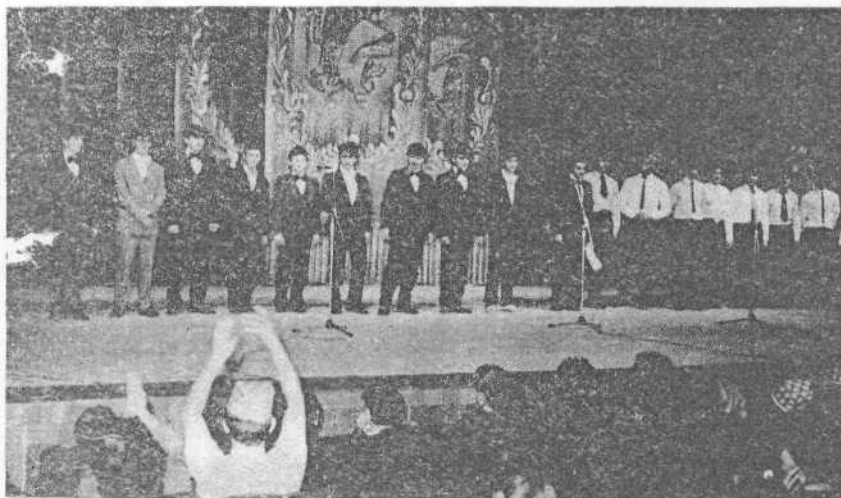
Финалисты представляют болельщикам жюри.