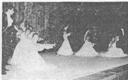
Паузы между заданиями заполняли участники художественной самодеятельности института. Выступает коллектив бального танца ФОП.