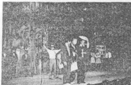
Победитель финала 1988 года команда ветфака приветствует финалистов 1989 года.