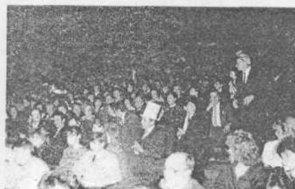
В зрительях недостатка не было. Болельщики заполнили весь концертный зал Дворца культуры и спорта профсоюзов.