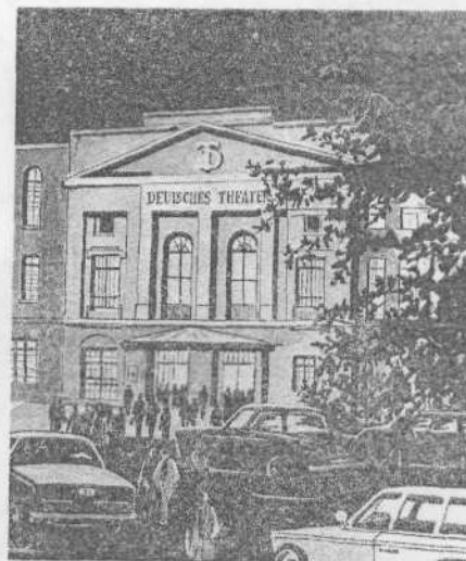
Берлин. Немецкий театр, в котором в 1895 году В. И. Ленин смотрел драму Г. Гауптмана «Ткачи».