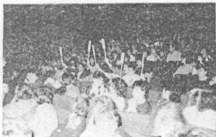
Беспристрастным было жюри.