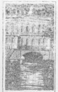
Берлин. Музей немецкой истории, в котором развернута экспозиция «Ленин в Берлине».