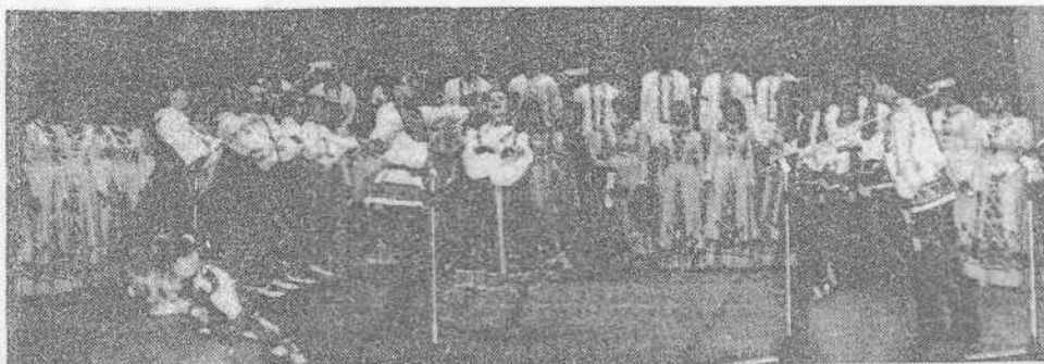
Фольклорный ансамбль «Полюшко».

В. КУРЧЕВ, декан ФОП. заслуженный работник культуры РСФСР.