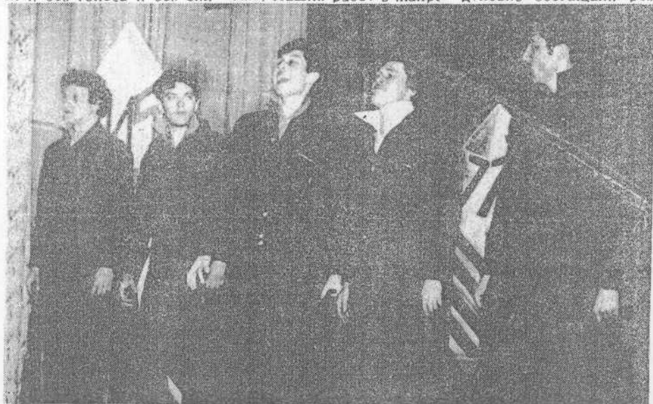
Сцена из спектакля студенческого театра чтеца «Собеседник» «Поедем в наш город», посвященный 200-летию Ставрополя.

артист Ставропольского краевого драматического театра им. М. Ю. Лермонтова, заслуженный артист РСФСР, руководитель театра чтеца «Собеседник».