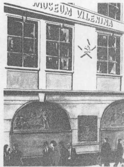
Прага. В этом доме в 1912 году проходила Пражская конференция. Рис. Н. Дюгуркува.

вет, не просили, а требовали: «Дай рекомендацию в комсомол». И давали, давали совершенно незнакомым людям, так как знали, что это все равно лишь формальность. Поэтому я считаю, что человек, давший рекомендацию, должен нести ответственность за того, за кого поручился. И награды, и взыскания полагают, причем со «старшего» спрашивать строже. Тогда не будут комсомольцы со стажем ставить свои подписи под первыми попавшимися заявлениями! И я предлагаю в Уставе ВЛКСМ четко определить обязанности рекомендуемого, обозначить его роль во время подготовки вступающего в комсомол и в последующей их совместной работе. Кстати, хорошо было бы оценивать и поощрять рекомендуемого за хорошую работу. Мне кажется, что это поможет комсомолу избавиться от случайных людей. Т. ВАСИЛЬЕВА.