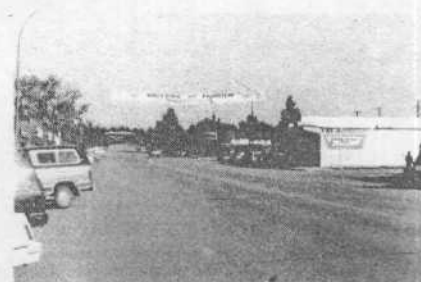
Центральная улица города Фейерью, где расположен колледж, в котором были наши студенты. На полотнище написано на русском и английском языках: «Мы приветствуем вас».