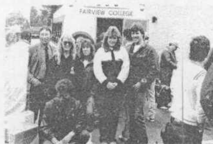
Канадские студенты, побывавшие на производственной практике на Ставрополье весной 1989 года, провожают наших студентов на Родину.