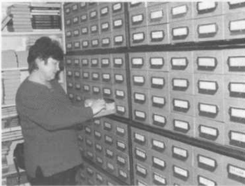
Отдел комплектования, научной обработки и организации каталогов научной библиотеки СтГАУ

Первые три места по степени значимости вышеперечисленных показателей в идеальной модели занимают полнота удовлетворения читательских