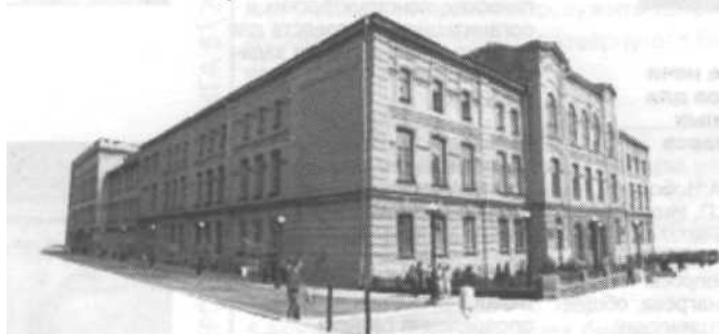
Здание Ставропольского государственного аграрного университета