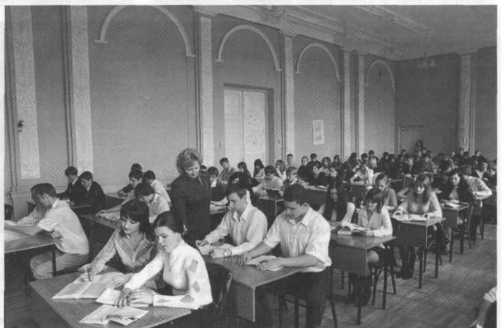
В читальном зале научной библиотеки Ставропольского государственного аграрного университета

В соответствии с приоритетами в управлении персоналом на данный период определены наиболее значимые качества работников: инициатива,